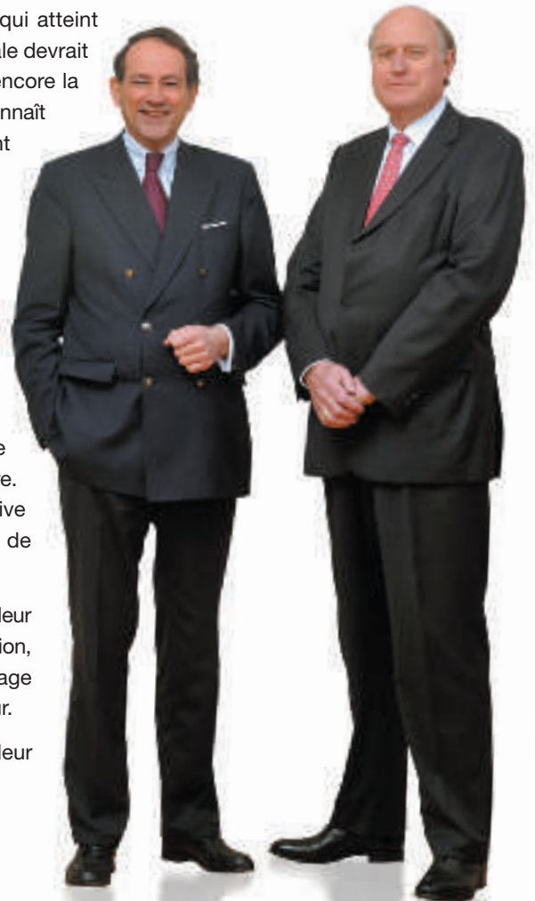
Les fondateurs du Groupe,